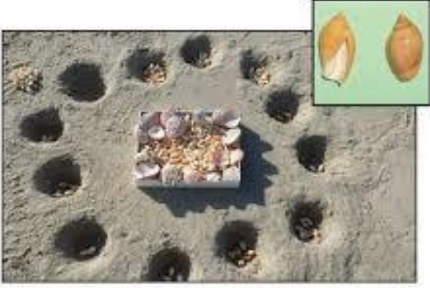
صورة تمثيلية للعبة الحالوسة. في الإطار: الصبان أو الحواليس

تعد لعبة الحالوسة من أشهر الألعاب الشعبية في الإمارات التي سادت قديماً، إذ تعد من تقاليد الإمارات المتوارثة ويعتبرها البعض شطرنج العرب، تعتمد اللعبة على تشكيل 28 حفرة في الأرض بحيث يلعبها طفلان، يتم تخصيص مجموعة محددة من الحفر لكل طفل، إذ تعتمد على الذكاء ودقة تحريك الحصى وتميرها عبر الحفر، فإذا ما اجتمعت حصتان في الحفر أخذها اللاعب ووضعها أمامه ومن يجمع أكبر عدد من الحصى في نهاية اللعبة يكن الفائز وهي من الألعاب الشعبية في الإمارات.